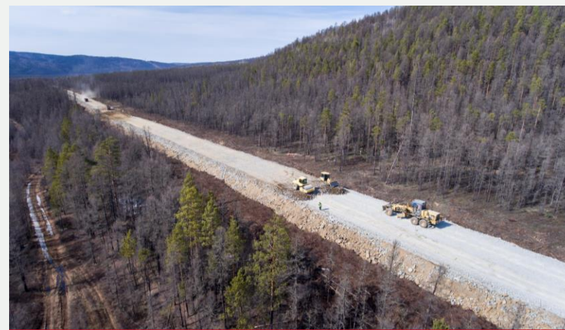
Реконструкция автомобильной дороги М-56 «Лена» от Невера до Якутска км 165 - км 172, Амурская область