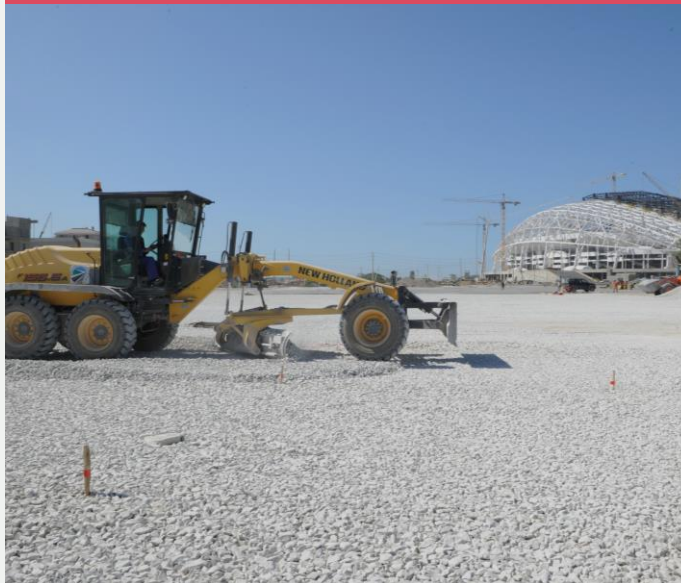
Строительство совмещенной (автомобильной и железной) дороги Адлер— горноклиматический курорт «Альпика-Сервис», а также объектов Олимпийского парка