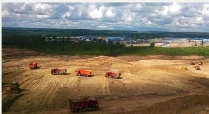
Амурская ТЭС. Обеспечение нужд Амурского ГПЗ